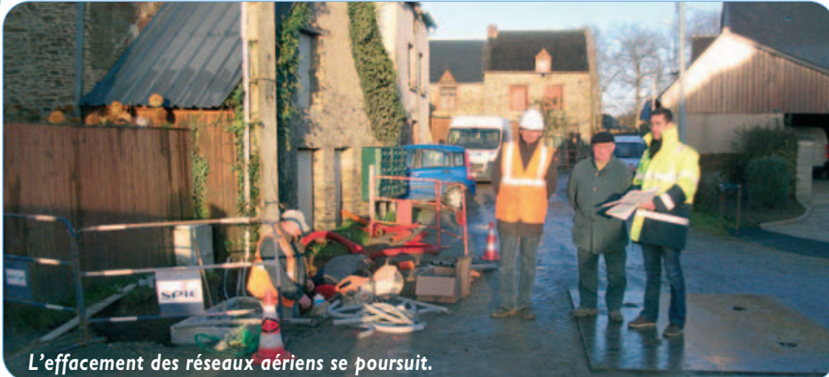
L'effacement des réseaux aériens se poursuit.