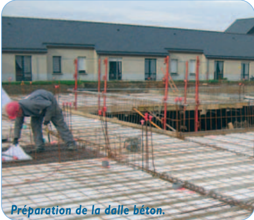
Préparation de la dalle béton.