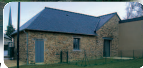
La face sud