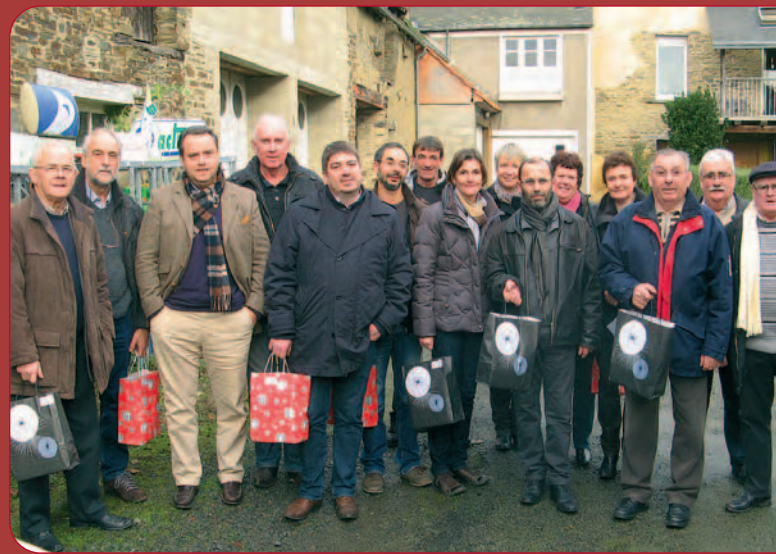
En décembre 2013, les élus sont allés distribuer les colis de Noël aux anciens de la commune.