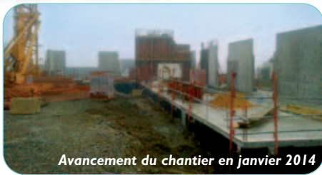
Avancement du chantier en janvier 2014

Rappelons comme nous vous en avons parlé dans le dernier numéro municipal que le rapport de l'évaluation interne a été remis fin novembre 2013 au Conseil Général et à l'Agence Régionale de Santé présentant la démarche, le bilan et un programme d'amélioration de la qualité pour lequel 48 fiches actions réparties sur les cinq prochaines années ont été rédigées.