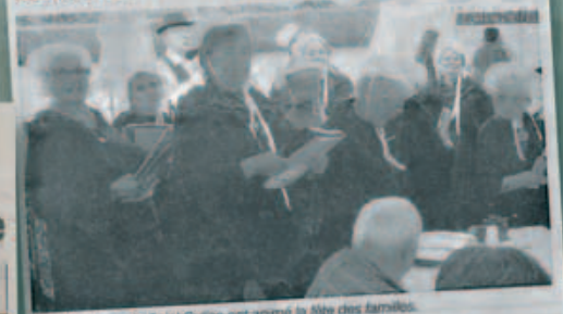
Les chanteurs de Saint-Suliac ont animé la fête des familles.

La fête des familles de la maison de retraite de la Marpa s'est déroulée samedi. Plus de 90 personnes se sont réunies pour fêter ensemble sous un chapiteau dressé pour l'occasion. Les convives ont pu profiter de la présence de la troupe de chants de Saint-Suliac pour danser et chanter des airs marçais et d'autrfois. Vincent