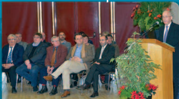
Le Maire entouré du Conseil Municipal

Bulletin municipal d'informations - N°26 Janvier 2014