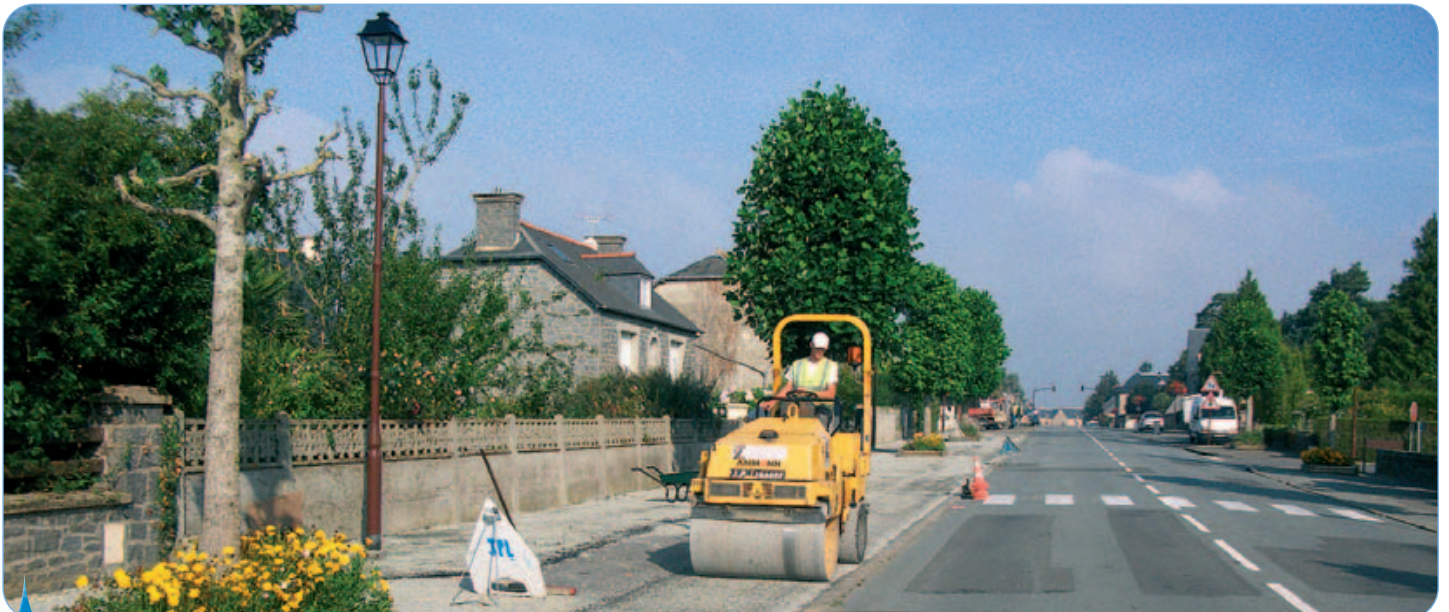
La réfection des trottoirs a été assurée par l'entreprise Le Hagre.