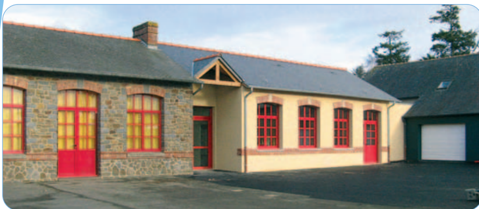
Vue de l'extension de l'école (côté cour).