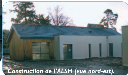
Construction de l'ALSH (vue nord-est).