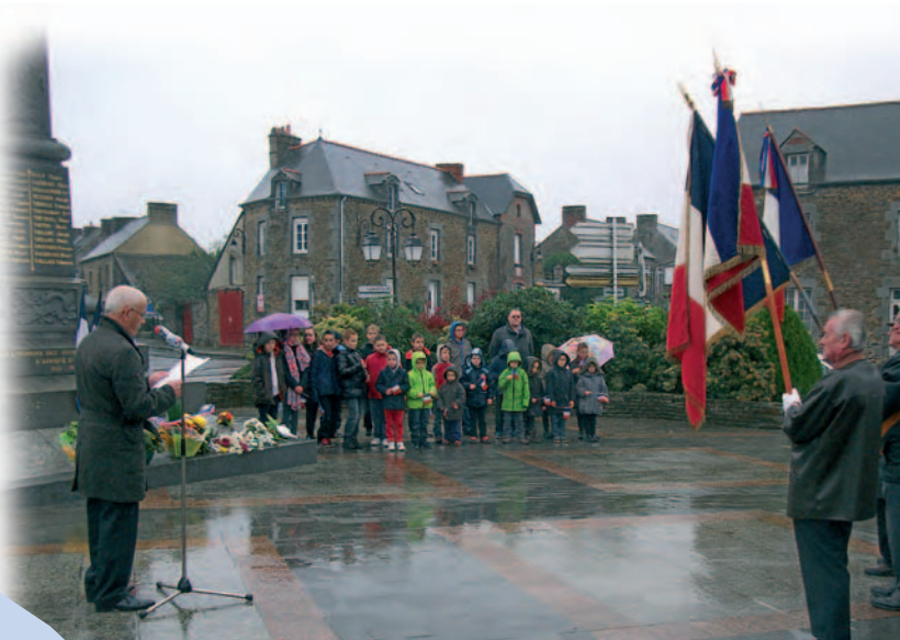
Le 11 novembre 2013, lecture du communiqué officiel pour les 99 ans de l'armistice.