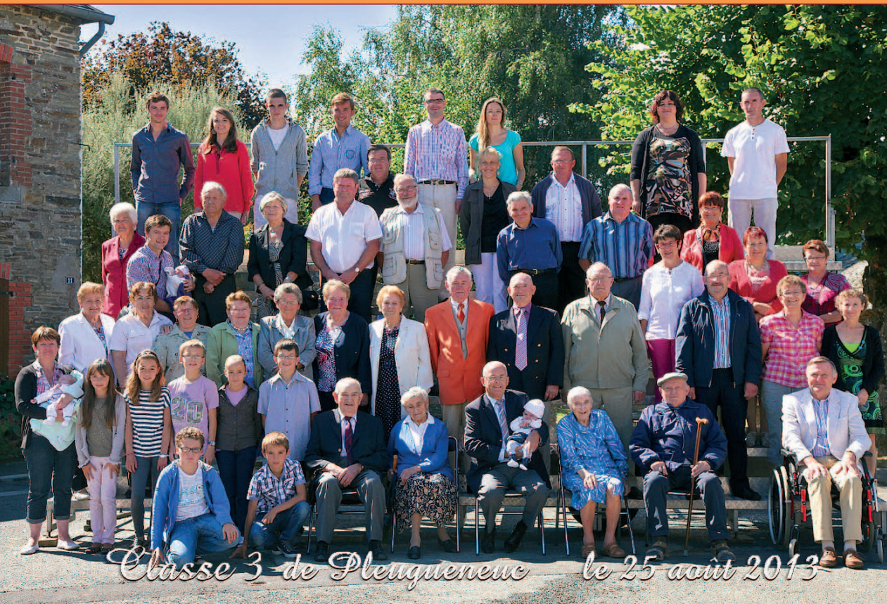
Classe 3 de Plougueneneuc le 25 août 2013