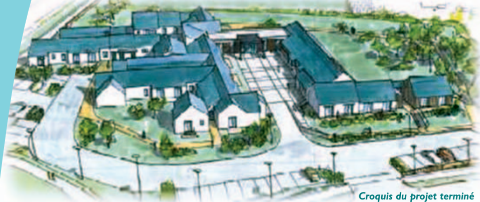
Croquis du projet terminé

velles places et la partie administration, le second tiroir pour la mise en conformité du bâtiment existant et les extensions des parties de vie commune (salon et salle à manger), des locaux du personnel.