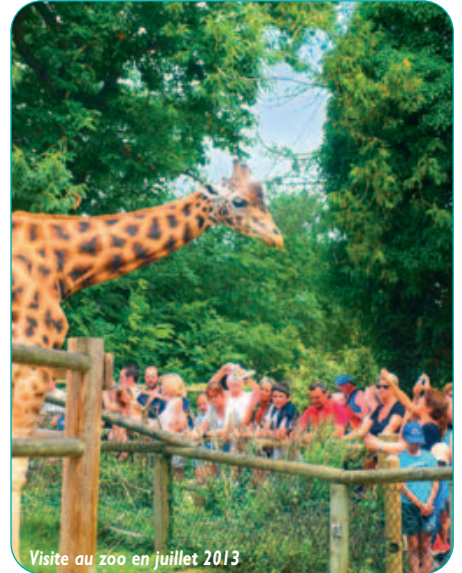
Visite au zoo en juillet 2013