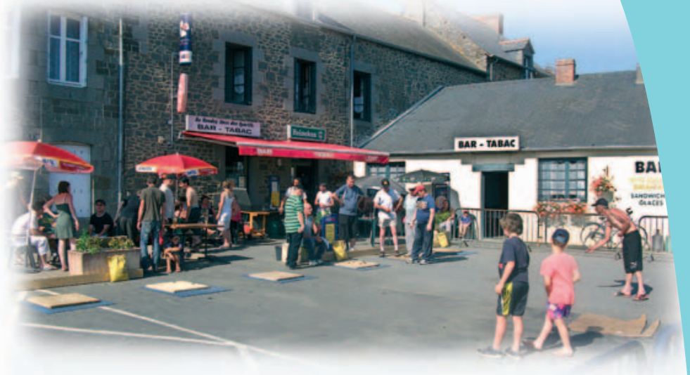
La chaleur n'a pas dissuadé les nombreux participants.

Au bar-tabac « Le rendez-vous des sportifs » était organisé, cet été, le 1er concours de palets : un succès qui devrait permettre à cet essai de se renouveler.