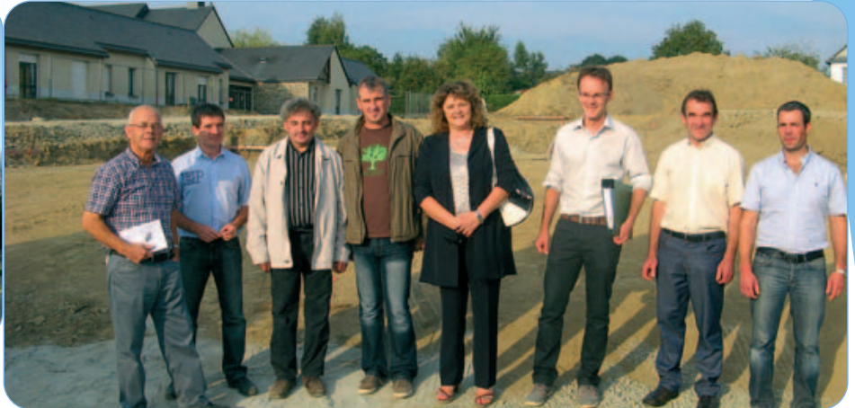
Réunion de lancement des travaux avec les élus de l'association de la MARPA

Les travaux ont débuté en septembre 2013 et devraient se poursuivre jusqu'en septembre 2015.