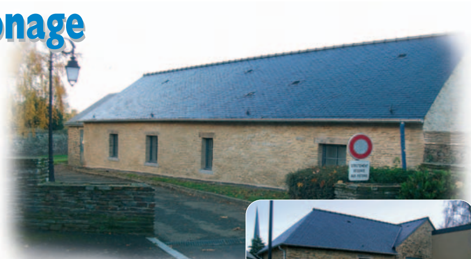
L'arrière du bâtiment, côté allée Jean-Briot

La réhabilitation de l'ancien patronage est achevée. Les 2 logements T2 sont habités depuis le 19 décembre dernier.