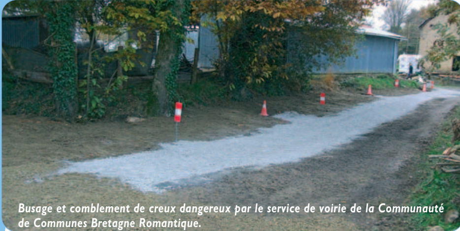
Busage et comblement de creux dangereux par le service de voirie de la Communauté de Communes Bretagne Romantique.