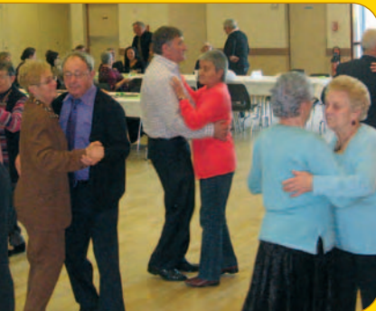
Le 8 décembre 2013 de nombreux convives ont à ce traditionnel repas offert par le CCAS. L'aïdi s'est poursuivi dans la bonne humeur.