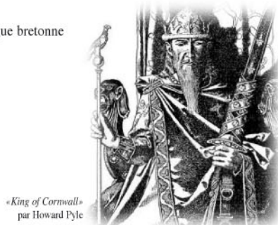
«King of Cornwall» par Howard Pyle

* Mac'hiern : le chef de clan en langue bretonne